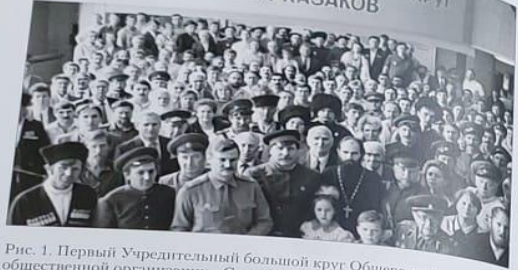
Рис. 1. Первый Учредительный большой круг Общероссийской общественной организации «Союз Казаков» (СКР) Москва, 29 июня 1990 г.