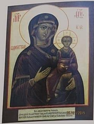
Рис. 10. Икона Божией Матери Смоленская «Одитрия».