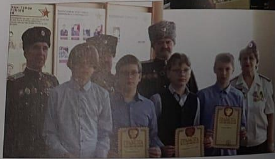
Рис. 11, 12. Волонтерский отряд «Казачий Спас» (Верховская средняя общеобразовательная школа № 2 Орловской области).