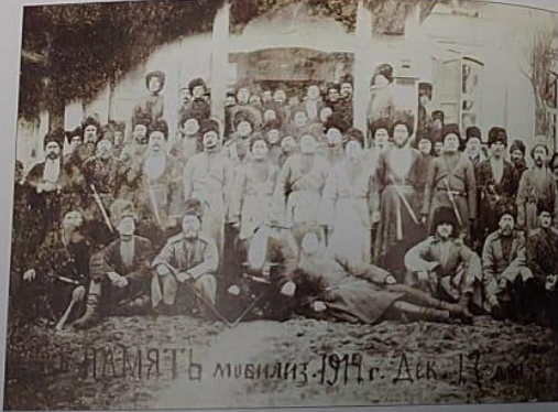
Рис. 1. Мобилизация казаков на Первую мировую войну. Слева три бригады. Станция Мартанская Краснодарского края. 17 декабря 1914 г.