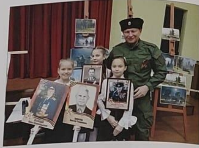
Рис. 15. Православная казачья школа им. А. А. Брусилова.