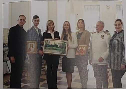
Рис. 14. На презентации благотворительного культурного проекта «Искусство — язык мира» в Российской государственной библиотеке.